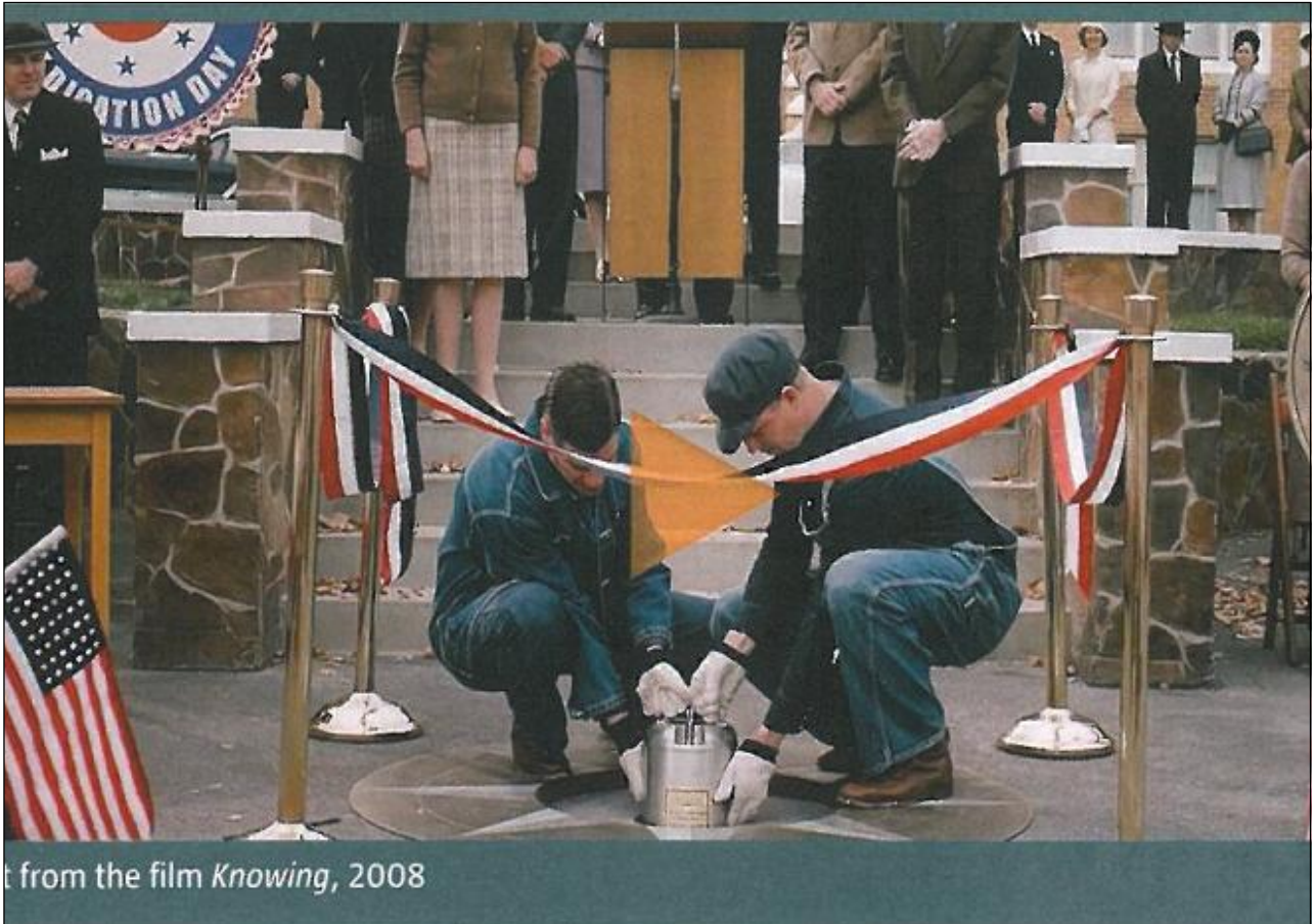
t from the film Knowing , 2008