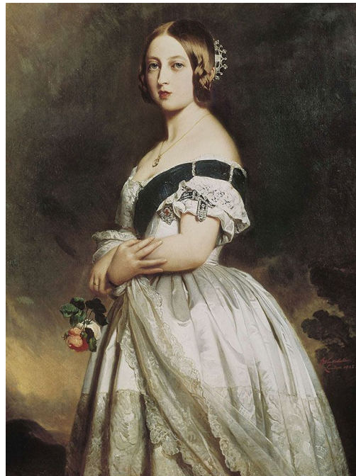
The young Queen Victoria, Franz Xaver Winterhalter