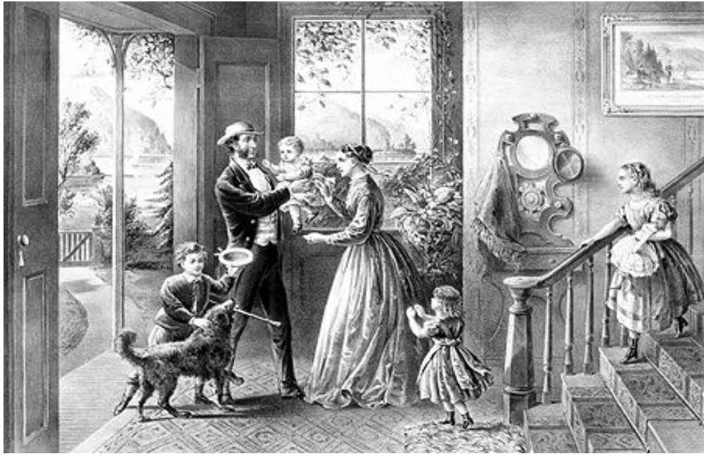
A middle class Victorian governess