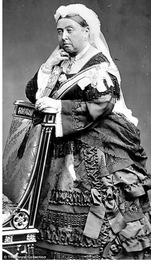
Queen Victoria of Great Britain, 1873