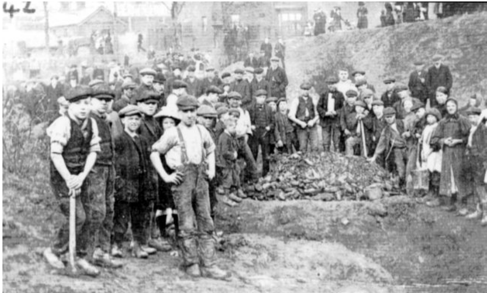
A photograph of children at work